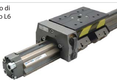
■ VL1 con blocco di stazionamento L6